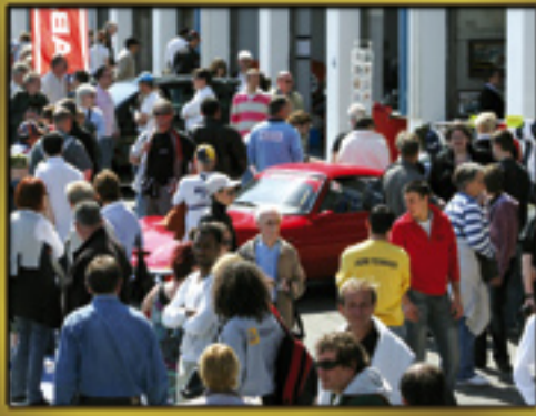
L'ESPRIT (Page 3)