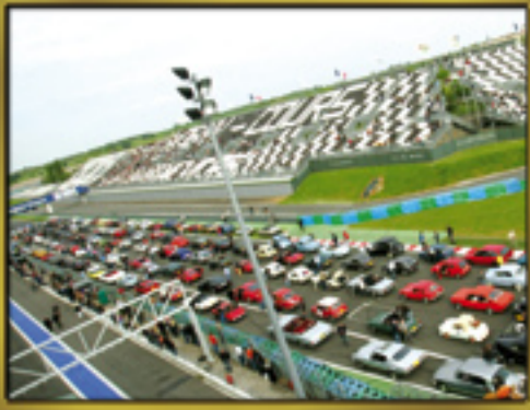
PARADE RECORD (Page 2)