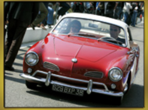
1 ER CLASSIC TOUR (Page 4)